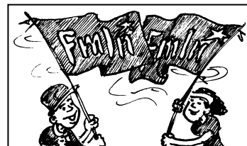
La izquierda, con fuerza y futuro

El FMLN entra al ring con varios adelantos: es un partido victorioso, que sacó a ARENA del Poder Ejecutivo y dirige los ministerios que más benefician al pueblo, como Educación, Salud y Obras Públicas. Tiene además, mayoría de diputadas y diputados y gobierna en 96 municipios. Pero la mayor ventaja de la izquierda sobre la derecha es la unidad del partido, su arrastre popular como primera fuerza política y el hecho de seguir encarnando los cambios que el pueblo quiere.