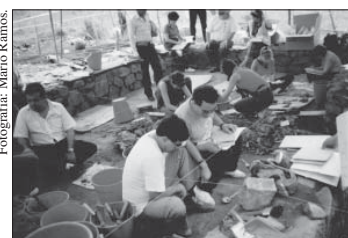
Exhumación de las víctimas de la masacre en 1992.

Y hasta hoy, todos los responsables de tan horrible masacre andan libres en las calles, muchos de saco y corbata. ¿Hasta cuándo la impunidad?