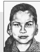
María Teresa Mirabal

viembre de 1960, cuando regresaban de la cárcel donde estaban apresados sus esposos, las tres hermanas Mirabal y el conductor de su vehículo fueron detenidas en la carretera y llevadas a un lugar donde fueron asesinadas a garrotazos.