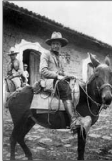
Gral. Augusto C. Sandino en San Rafael del Norte. 1933.

muerter y generaron escasez de comida y alza de precios de los alimentos.