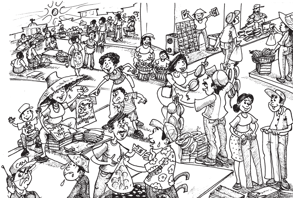
Bajo el caliente sol y las frías noches, las y los vendedores resisten

A un mes de la gaseada, garroteada, destrucción de puestos de venta y el decomiso y robo de mercadería, las y los vendedores desalojados del centro capitalino siguen siendo víctimas de la crueldad y del cinismo del alcalde y candidato de ARENA, Norman Quijano. Hoy son quienes venden en la calle, mañana podrías ser vos. Apoyémosles.